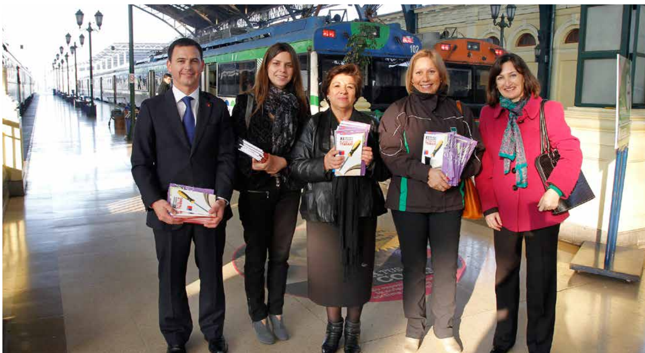
Las dos últimas versiones del concurso literario han sido lanzadas en los andenes de la Estación Central para entregar ejemplares de versiones anteriores a los trabajadores que desembarcan del Metrotren para iniciar su jornada laboral en Santiago.